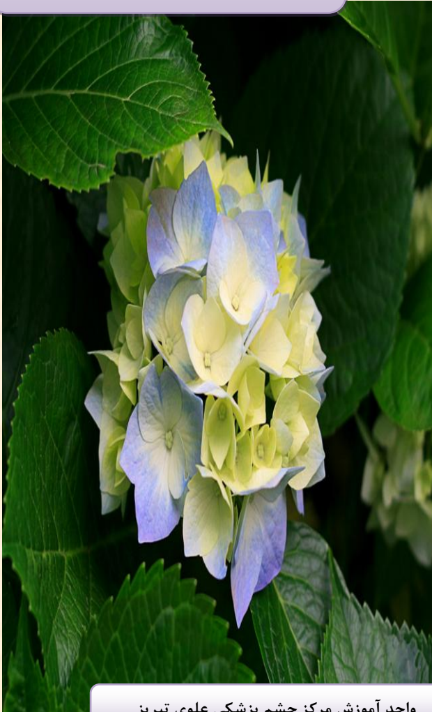
واحد آموزش مرکز چشم پزشکی علوی تبریز